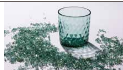
琉球コクーン見学

県外で廃棄処分するしかなかった廃車の窓ガラスを琉球ガラス職人の技術でアップサイクルするプロジェクトが実現。「mado」シリーズのストーリーから、SDGsの意識を学びましょう。